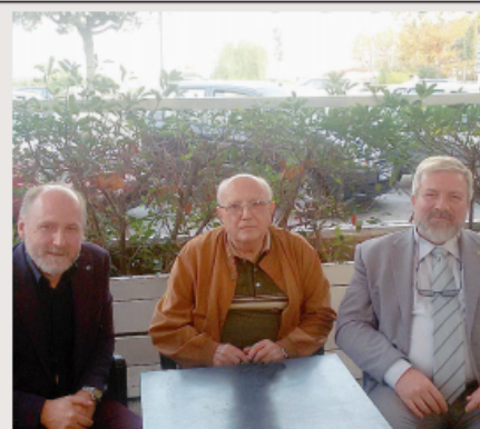
■ Gli esponenti delle associazioni